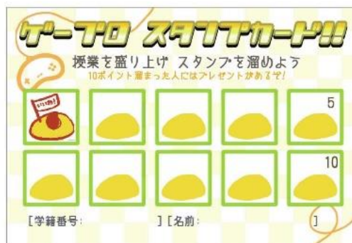
実際に使われたスタンプカード