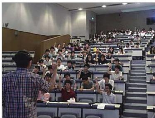
学生が積極的に参加する授業

学生にグループワークをさせて、自身の発言ができるようにしました。自分の意見が認められた学生には自己肯定感が芽生えるというのも大事な要素のひとつです。